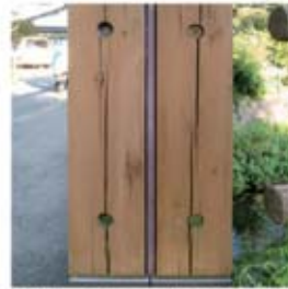
水洗→ノンロット2回塗り