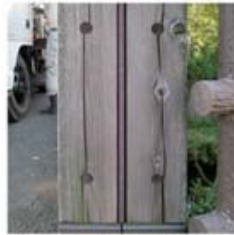
無処理(15年経過したヒノキ)

木部塗り替え時、下地処理後にリグノブライトを下塗りした後に木材保護塗料を上塗りすることにより、下塗り無しに比べて木らしさを失わず明るく仕上がります。