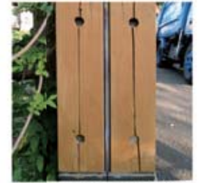
塗り替え後3年経過した状態