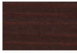
▲SG-RBR (ラスティックブラウン)