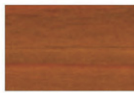
▲SG-NAT (ナチュラルチーク)