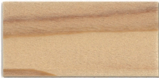
▲クリーン クリアー