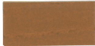
▲SG-YMRイエローメランチ