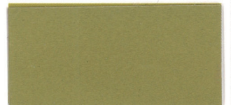
▲SG-OGFオリーブグリーン