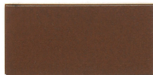
▲SG-NATナチュラルチーク