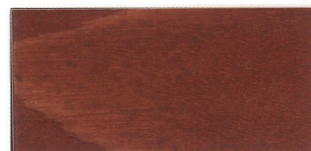
▲ZS-MRマホガニーレッド