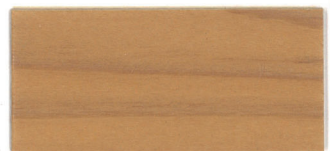
▲ZS-CNクリアーナチュラル