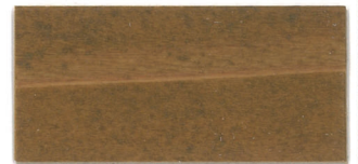
▲ZS-NO/▲C-NOナチュラルオーク