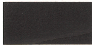
▲ZS-ABアンティークブラウン