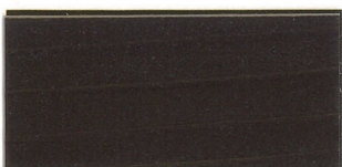
▲SG-RBRラスティックブラウン