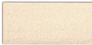
▲SG-HWHホーリーホワイト